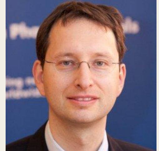
Projektledare: Dan Henrohn, Läkemedelsverket